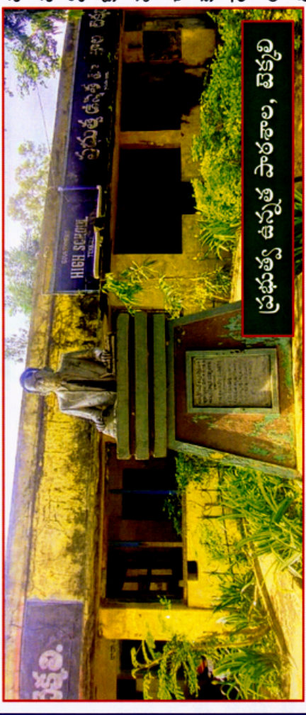
ప్రభుత్వ ఉన్నత పాఠశాల, టెక్నాలజీ